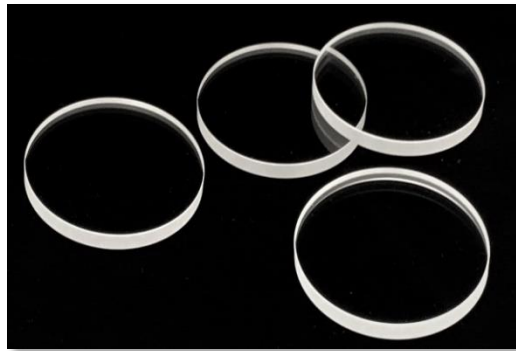
【サファイア透過率 (Transmittance)】

For sizes not listed in the table or in large quantities are made to order, so please contact us for more information.